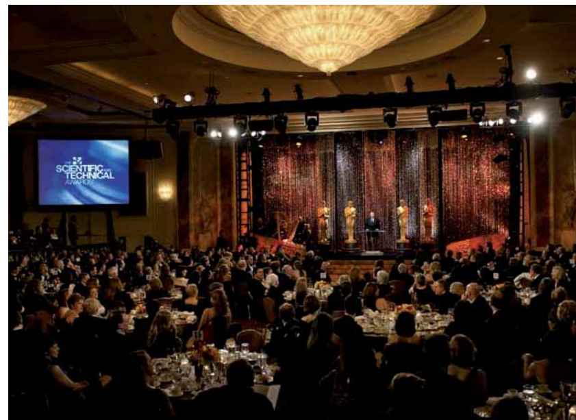
Technische Gala: Zwei Wochen vor den »Oscars« zeichnet die US-Filmakademie herausragende Filmtechnik aus.

Zum anderen der Spirit 4K/2K , ursprünglich eine Entwicklung von Philips in den Niederlanden und erstmals 1996 vorgestellt. Über Firmenumstrukturierungen und damit verbundene Verkäufe gelangte die Technik erst an